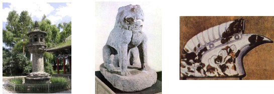
<석등> <돌사자상> <치미>